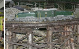
Gute Fahrt im 2014