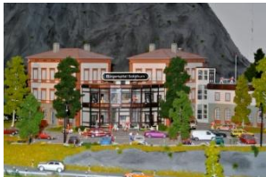
Besuch Anlage Solothurn