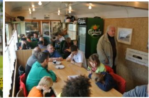
Tag der offenen Tür