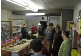
April letzter Tag Zuber