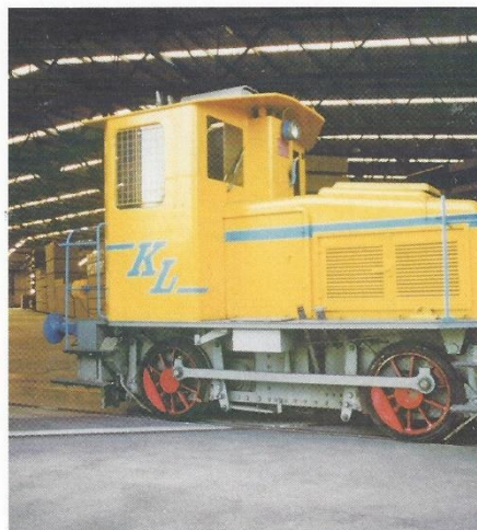
«Eusi Loki» auf dem Schienenweg vom Bahnhof direkt ins Lager