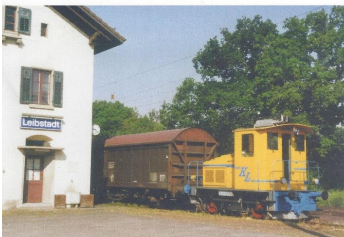
Bis 1995 hatte Leibstadt eine eigene Bahnstation